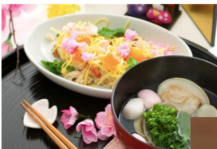
すし ちらし寿司とはまぐりのお吸い物