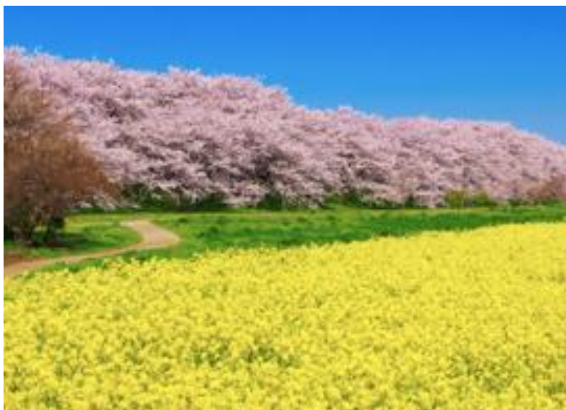
桜と菜の花（さくらとなのはな）